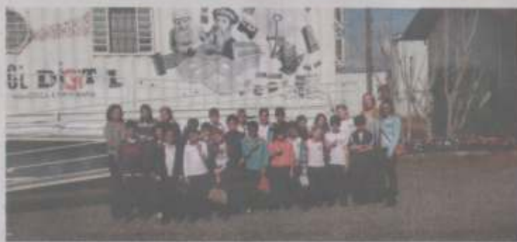
Projeto Board na inauguração em dezembro de 2015